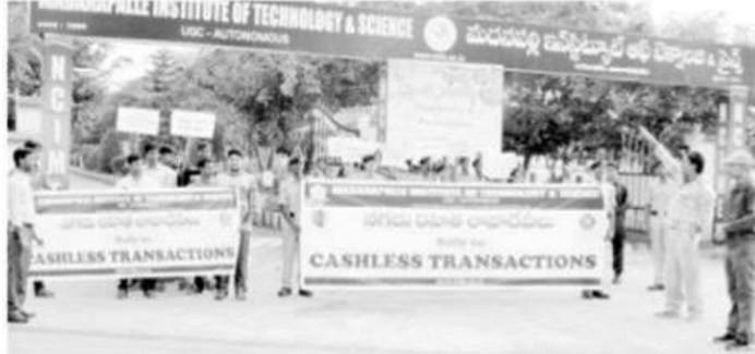
నగదు రహిత లేవాదేవీలపై ర్యాలీ చేస్తున్న మిట్స్ విద్యార్థులు

కురబలకోట డిసెంబర్ 18 (కెఎన్ఎస్) అంగళ్ళ సమీపంలోని మదనపల్లె మిట్స్ ఇంజనీరింగ్ కళాశాల వారు నగదు రహిత సమాజం కోసం ర్యాలీని మంగళవారం నిర్వహించారు. ఈ ర్యాలీ ఎన్ఎస్ఎస్ మరియు ఎన్సీసీ విద్యార్థులు నిర్వహించారు.